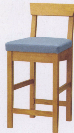
ナチュラル 張地: レザー・ヘリング・LB(B)