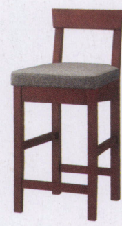
ブラウン 張地: 布・トラッド・TR-2001(E)