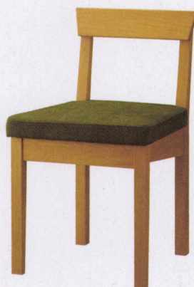
ナチュラル 張地: 布・カプリス・8(D)