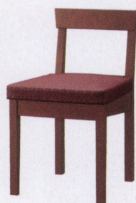
ブラウン 張地: レザー・麻葉繫・UP5473(C)